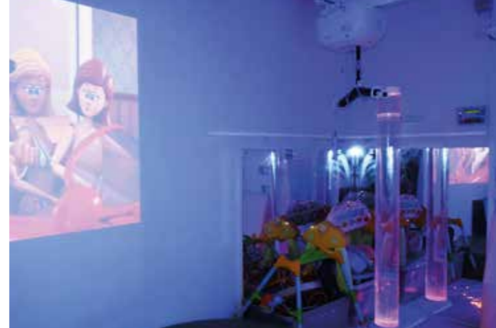
設計心思細密的觸感遊戲室，刺激病童的不同感官。