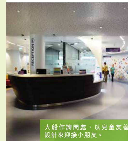
大船作詢問處，以兒童友善設計來迎接小朋友。