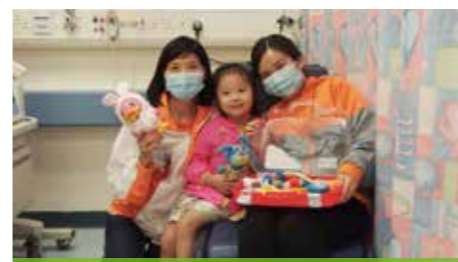
笑著完成檢查，是病童戰勝恐懼的一次小成就。

幼兒的專注期一般較短，所以，要二十分鐘全程保持「身體處於靜止狀態」，乖乖不動，可謂難以完成的任務，因此，病童會經常出現很多不由自主的小動作，如踢腳、轉身及搔癢等；當家長或醫護人員說「不要動」，卻引起幼兒不耐煩的情緒，繼而放聲哭鬧，沒完沒了。