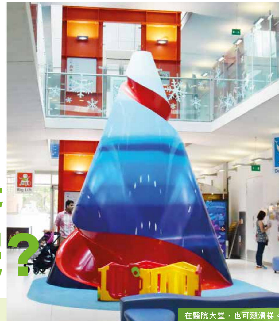
在醫院大堂，也可灑滑梯。

兒童醫院的對象是小朋友，環境的設計符合兒童的喜好自是理想不過。Great Ormond Street Hospital For Children的大堂是一片海洋，詢問處是一艘大船，牆上佈滿可愛的海洋生物，在海洋暢泳的大魚小魚奇魚更是病童的作品。Evelina London Children's Hospital的大自然設計意念也同樣令人驚喜萬分，有想過一個奇特奪目的山形滑梯會坐落在醫院大堂嗎？有想過醫院樓層及病房會擺脫一般數字和字母，而改以天空、山峰、海洋、森林來命名嗎？