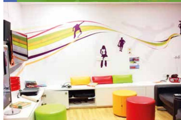
青少年病人也是服務對象，可在專用活動室放鬆身心。