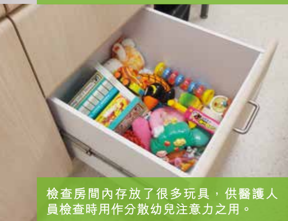
檢查房間內存放了很多玩具，供醫護人員檢查時用作分散幼兒注意力之用。