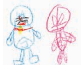
願望二：「多啦A夢」醫生及「超級英雄」醫生