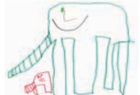
願望四：在大象滑梯上開心玩

這些願望可以實現嗎？副題為童夢中的醫療樂園的「小熊醫院」，就嘗試踏出這一步。「童樂治療中心」中以趣味的醫院遊戲方式，與參加者玩模擬醫療程序遊戲，試試拆石膏、照心電圖、做換腎手術；「童趣病房」就齊來玩轉病房，將病床變成枕頭山、在不同部門以隨意門縱橫穿梭、將大型注射器變成噴射畫筆、或躺在大型鹽水袋上盪來盪去……「童玩遊樂場」則屬少有的廣闊綠草空間，內有紙皮滑梯、紙迷宮、大型波波、奇形積木等，供小朋友任跑任跳任闖任砌任玩。「小熊醫院」不但大受小小參加者的歡迎，連被邀請前來的病童，也大呼好玩有趣。