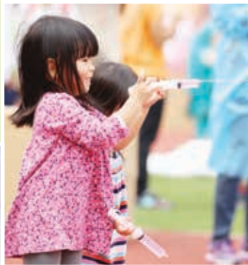
從遊戲角度出發，注射器也可成為玩水玩意。