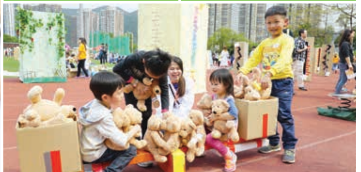
具平衡功效的搖搖板變成量度體重的工具，好玩！