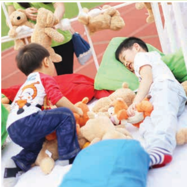
病床滿佈大量枕頭，軟軟綿綿，引人入眠。