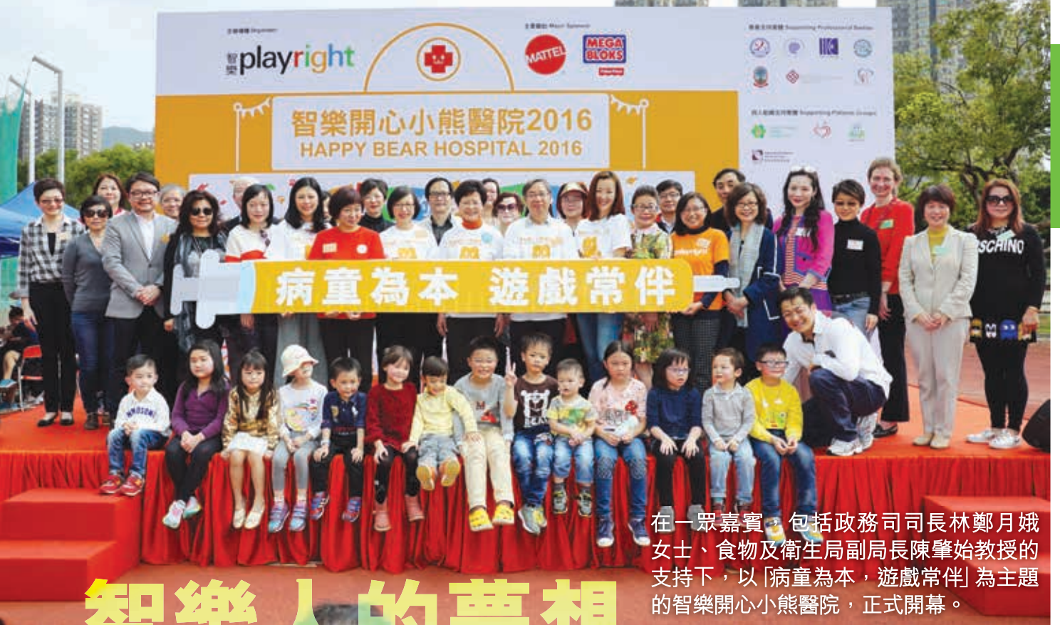
在一眾嘉賓，包括政務司司長林鄭月娥女士、食物及衛生局副局長陳肇始教授的支持下，以「病童為本，遊戲常伴」為主題的智樂開心小熊醫院，正式開幕。