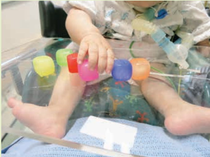
在遊戲中，小丸子與一般小朋友沒有分別，對方形冰大感好奇。

醫院遊戲師與小丸子初次見面時，發現小丸子細小的身軀插滿了喉管，有些用作呼吸(即「插喉」、有些用作進食、有些注射藥物。當評估小丸子的狀況及對外界的反應後，得知她對音樂和人聲有正面回應，但卻抗拒觸感。遊戲師因而選取講談故事及播放音樂等遊戲方式，繼而慢慢加入不同的感官刺激，如玩冰粒、玩沙及玩香味麵粉糰等，以配合此年齡的成長需要。