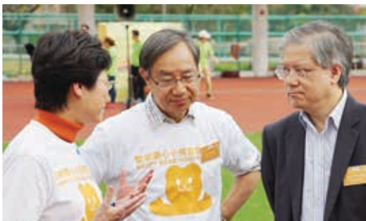
政務司司長林鄭月娥(左)、香港兒童醫院行政總監李子良醫生(右)在智樂兒童遊樂協會主席周鎮邦醫生(中)的介紹下，參觀小熊醫院。