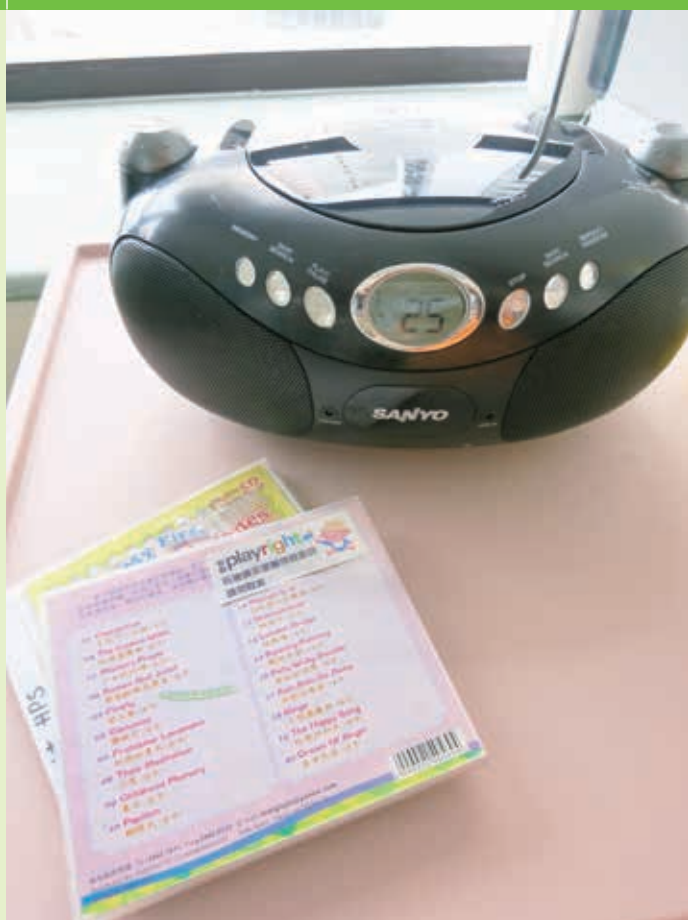
醫院遊戲師精心輯錄的小丸子歌集。

儘管小丸子仍然需要依靠呼吸機維持生命，更不時遇到危急情況，但每一天的住院日子，她仍可沉醉於悅耳的音樂中，輕輕擺動身體，玩著玩具和遊戲，開心愉快地長大成人。