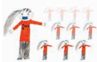
願望一：有一千位醫院遊戲師

病童也是小朋友，小朋友想玩，也是「童」之常情，所以不難發現，卧病在床的病童也終日嚷著玩呀玩。「小熊醫院」中新增的願望牆，就以童心童畫展示了在智樂服務醫院中各方病童的不同夢想，有病童希望有一千位醫院遊戲師，有些期待遊戲室的出現、有枱有椅來做手工、有些想以精製小車往返接送病童、有些說要走出病房去瀝大象滑梯、或踩單車挑戰「尖刺橋」，更有病童幻想醫生會變成多啦A夢或超級英雄。