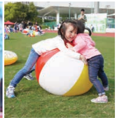
圓碌碌的波波遊戲，人見人人愛。