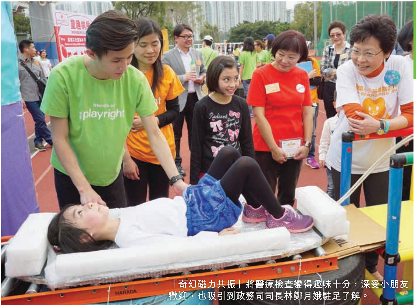
「奇幻磁力共振」將醫療檢查變得趣味十分，深受小朋友歡迎，也吸引到政務司司長林鄭月娥駐足了解。