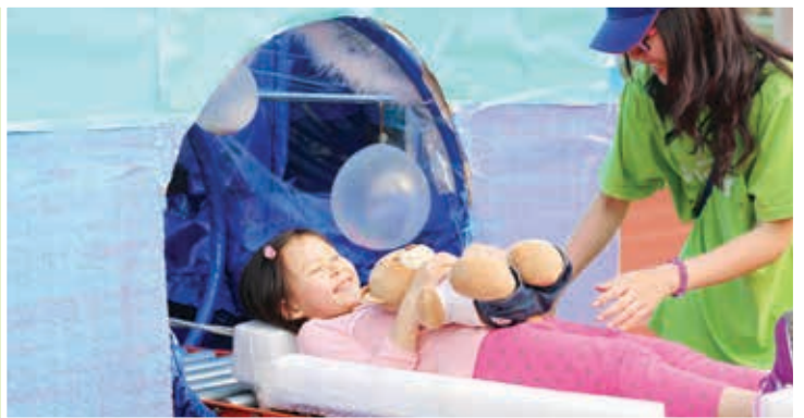
玩過像真度甚高的「奇幻磁力共振」後，還怕MRI檢查嗎？

這些願望可以實現嗎？副題為童夢中的醫療樂園的「小熊醫院」，就嘗試踏出這一步。「童樂治療中心」中以趣味的醫院遊戲方式，與參加者玩模擬醫療程序遊戲，試試拆石膏、照心電圖、做換腎手術；「童趣病房」就齊來玩轉病房，將病床變成枕頭山、在不同部門以隨意門縱橫穿梭、將大型注射器變成噴射畫筆、或躺在大型鹽水袋上盪來盪去……「童玩遊樂場」則屬少有的廣闊綠草空間，內有紙皮滑梯、紙迷宮、大型波波、奇形積木等，供小朋友任跑任跳任闖任砌任玩。「小熊醫院」不但大受小小參加者的歡迎，連被邀請前來的病童，也大呼好玩有趣。