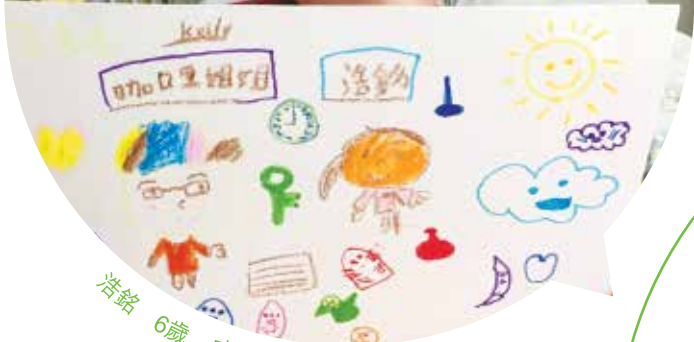
浩銘 6歲 威爾斯親王醫院