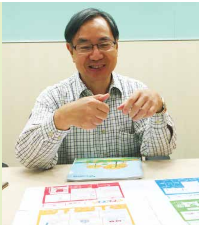
智樂兒童遊樂協會的主席周鎮邦醫生

對於收集病童的聲音安排，周醫生大表支持，認為應該定期聆聽病童的心聲、想法、感受、需要和期望：「圖畫讓大人了解小朋友，是遊戲以外的另一種溝通方法，也是開展兒童參與的重要一步。」