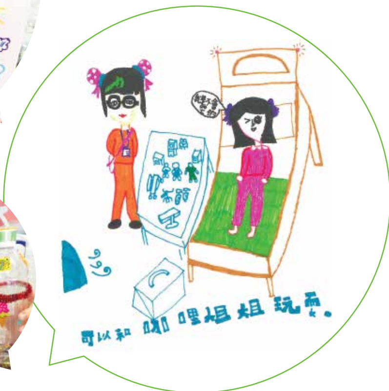
心柔 8歲 威爾斯親王醫院