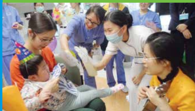
你扮羊、我扮小狗，昭昭也感受到派對的熱鬧歡欣。