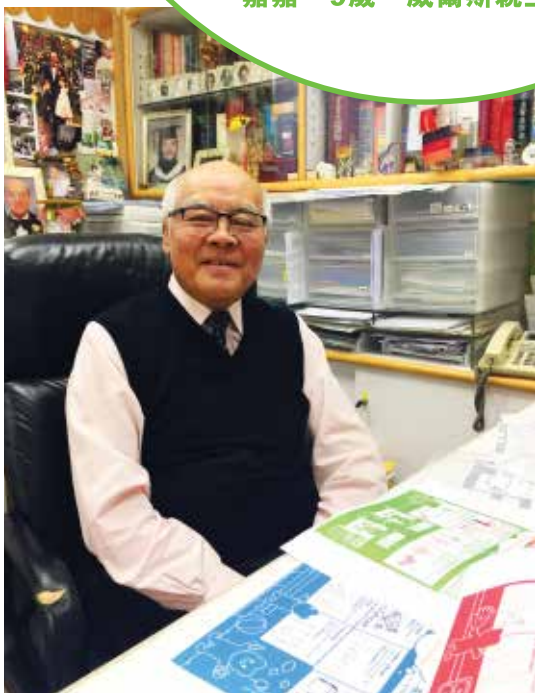
香港兒科基金董事會主席及國際兒科醫學會前會長陳作耘醫生

對病童的天真奇想，香港兒科基金董事會主席及國際兒科醫學會前會長陳作耘醫生深明箇中原因，指出小朋友無論患上急病還是慢性病而住院，均會掛念家人，對醫院事事卻不熟悉，也要面對有限的活動空間、轉變的日常作息，難免感到恐懼、煩躁、不安和無助。