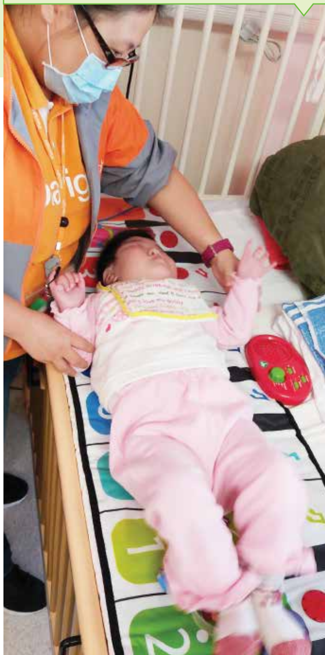
悠和的哼唱對穩定昭昭的情緒起了很大作用。

由於昭昭沒有發聲，唯一可見的重複動作是呼吸，醫院遊戲師因而隨著昭昭一呼一吸的節奏來哼出歌兒，這正是遊戲中常見的同步原則，以模仿對方來加強連繫，讓對方感到被聆聽，其表達的訊息也被清楚接收。