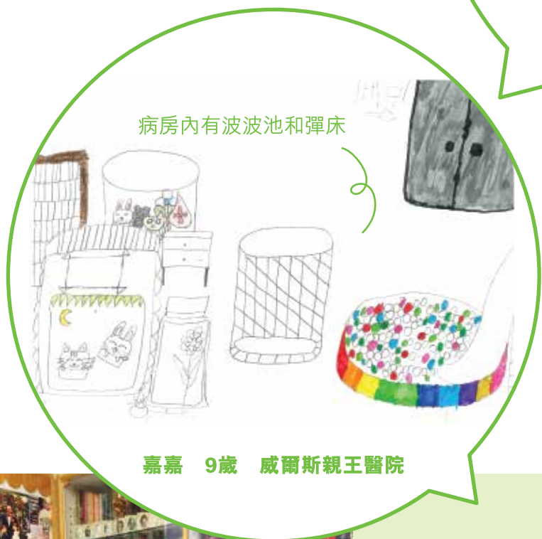
嘉嘉 9歲 威爾斯親王醫院